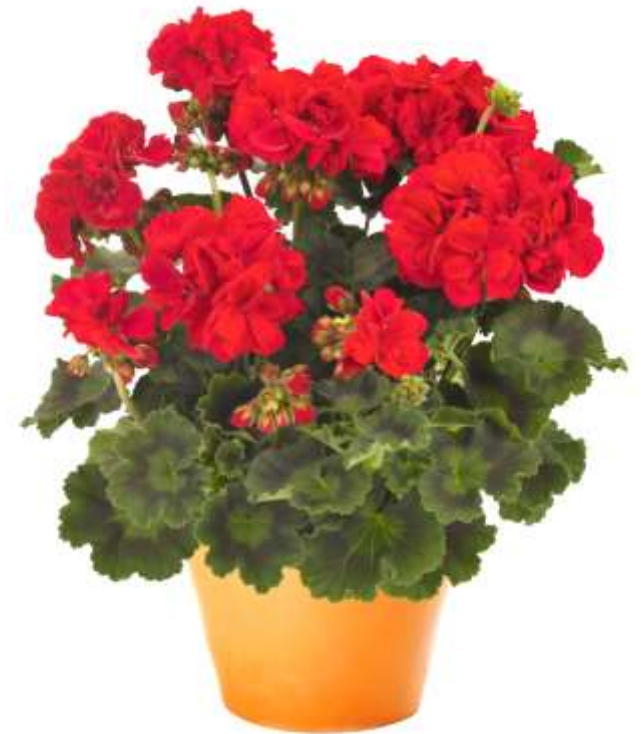
Pelargonie Savannah Really Red