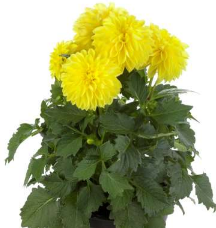
Dahlia Labella Grande Yellow