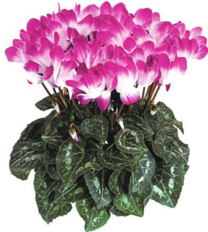
Cyclamen Indiaka Violet