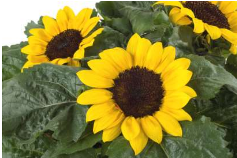
Sonnenblumen Sunray Yellow