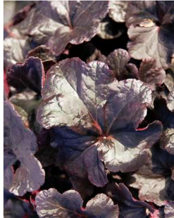
Heuchera Primo Wild Rose