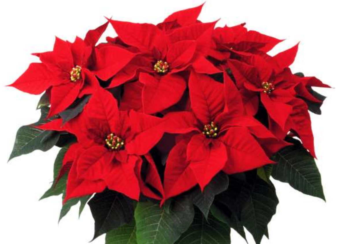
Weihnachtsstern Prima Red