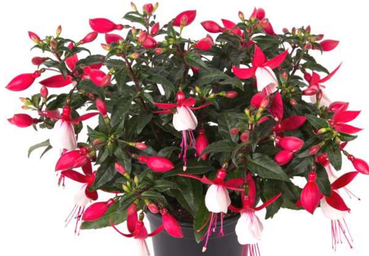
Fuchsia Bella Evita