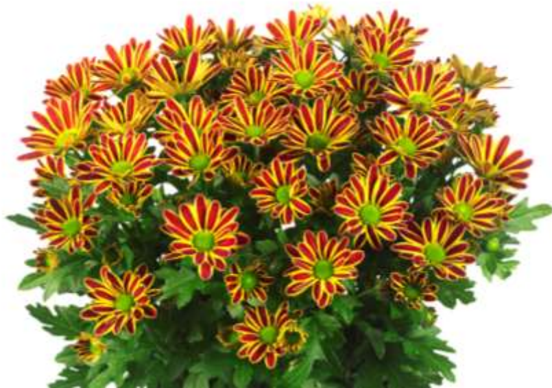
Chrysantheme Swifty Bronze Bicolor