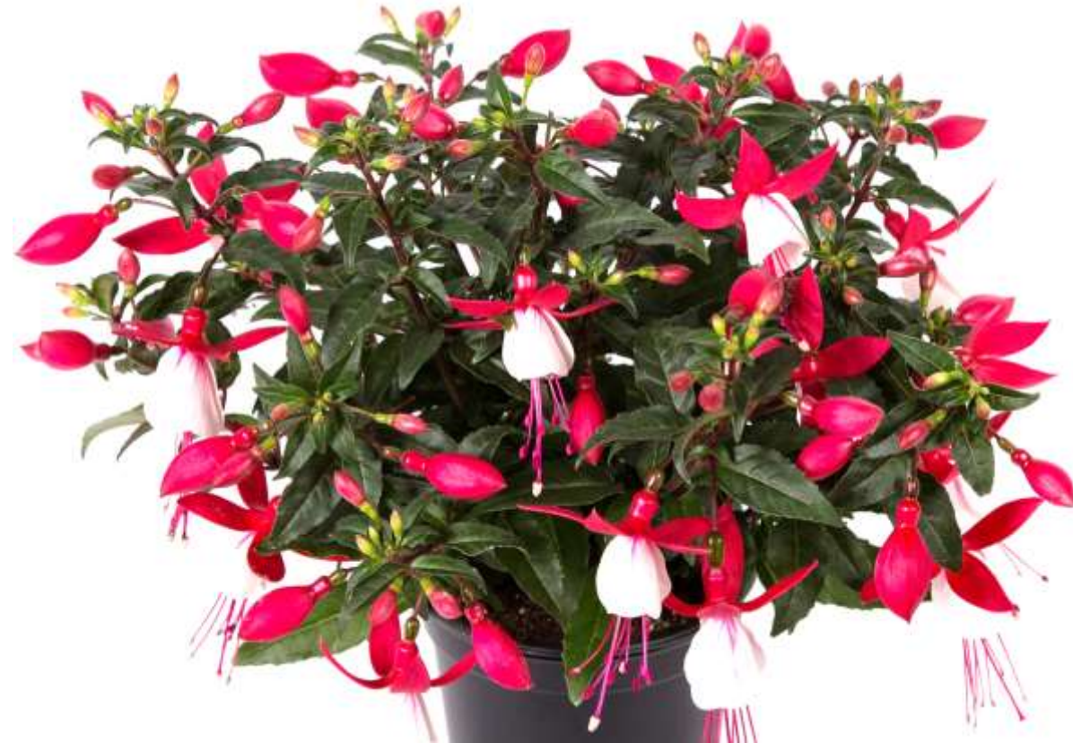
Fuchsia Bella Evita