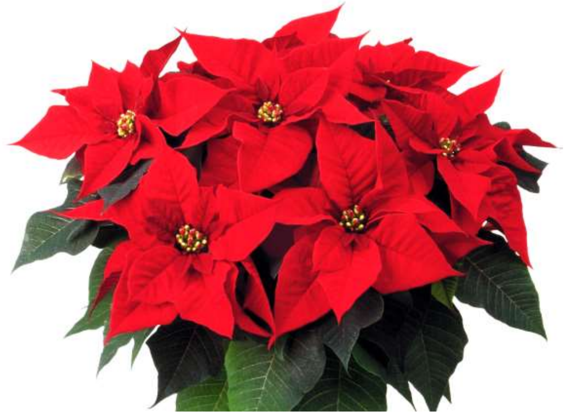
Weihnachtsstern Prima Red